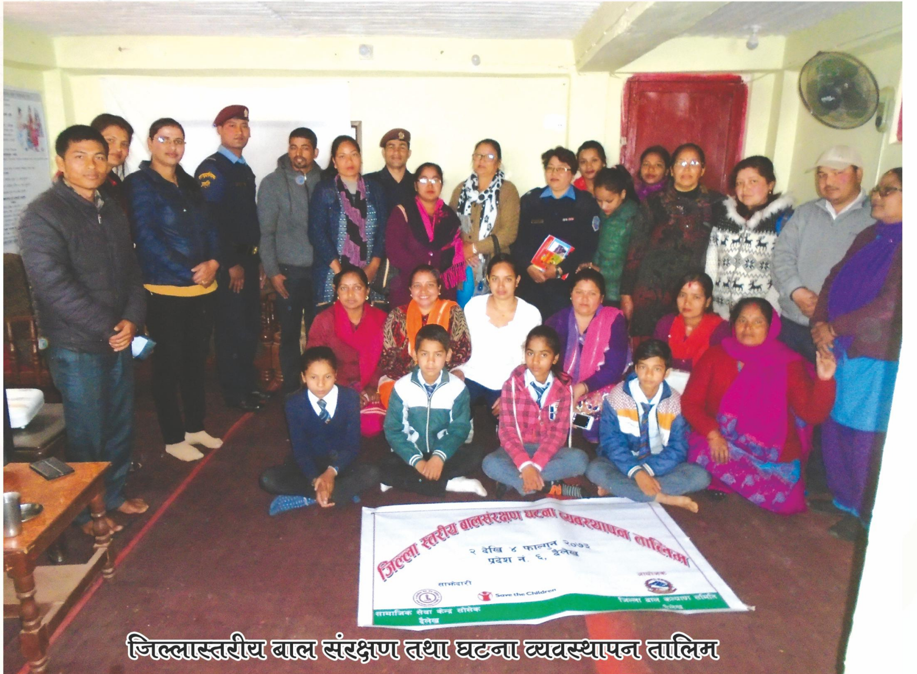
जिल्लास्तरीय बाल संरक्षण तथा घटना व्यवस्थापन तालिम

जिल्लास्तरीय प्रतियोगितामा प्रथम भएको निबन्ध